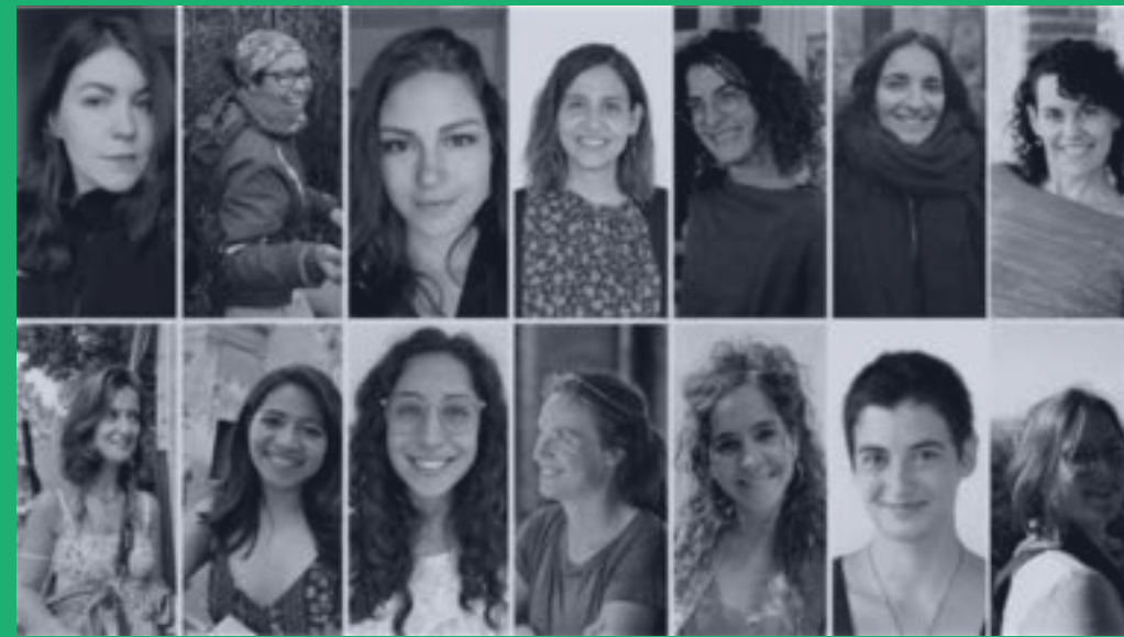
Soapbox Science Berlin Team

Soapbox Science mimics that tradition by inviting female* scientists to stand on a soapbox and present their work to the public. Speakers don't talk about being women* in STEM, they talk about their research; but by being visible, accessible and engaging, they have the opportunity to become role models.