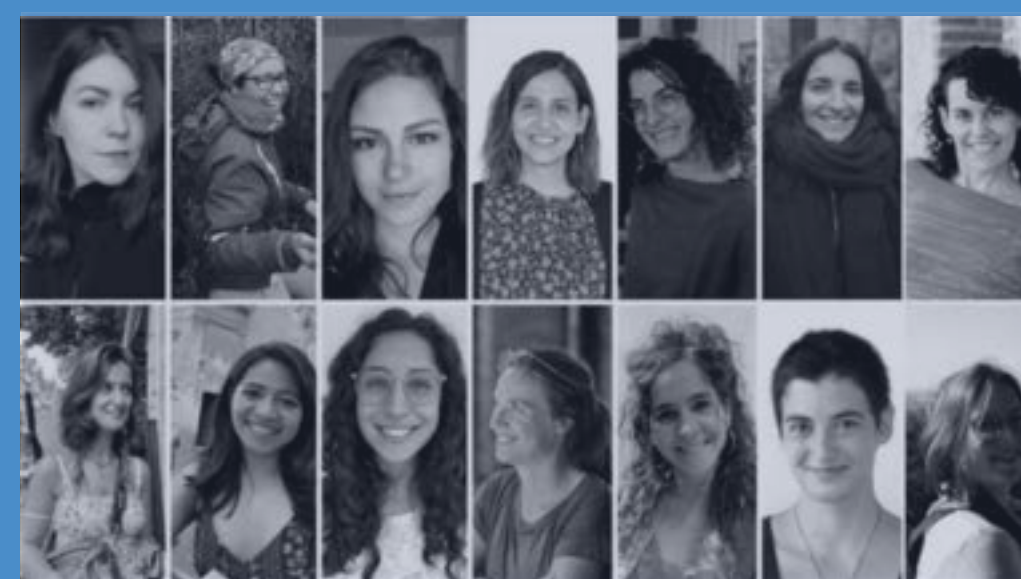
Soapbox Science Berlin Team

Soapbox Science spiegelt diese Traditionen wider, indem sie Wissenschaftlerinnen* einlädt, sich auf Seifekisten zu stellen und von ihrer Arbeit zu erzählen. Dabei reden sie nicht davon, wie es ist eine Frau* in den Natur- und Ingenieurwissenschaften zu sein, sondern was ihre Forschung ausmacht. Und während sie sich sichtbar und greifbar präsentieren und dabei das Publikum in ihren Bann zu ziehen, bekommen sie gleichzeitig die Möglichkeit, Vorbilder zu werden.